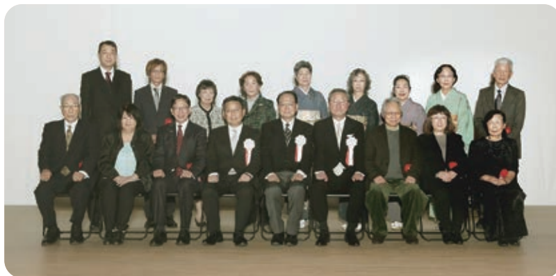
※表彰式参加者による集合写真