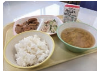
キャベツとたまねぎのみそ汁