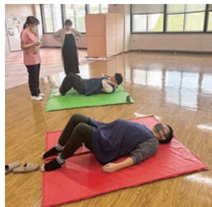
10月26日に開催した第2回教室の様子