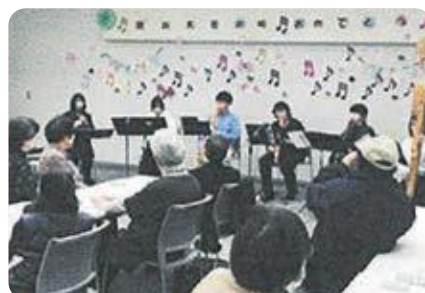
地域食堂「みんなの食堂まーる」開催事業