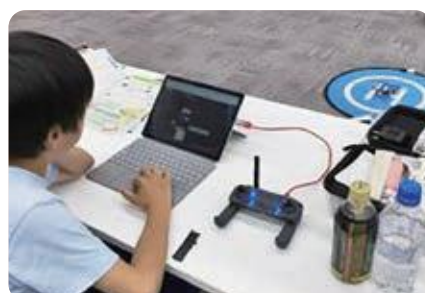
デジタルで彩る別海の未来プロジェクト開催事業